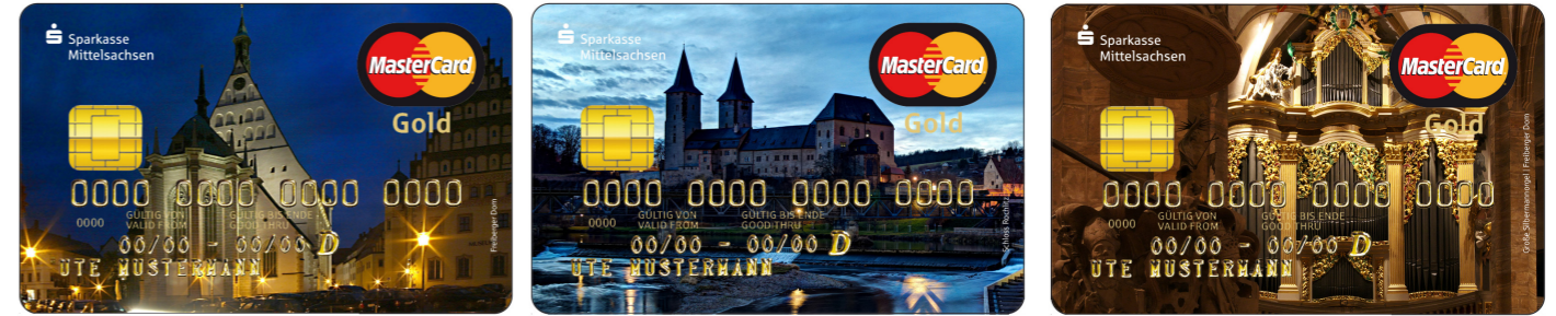
Eine Auswahl unserer Motive für die Gold-Kreditkarten

* Alle Preise und Angaben ohne Gewähr. Gegebenenfalls weitere Entgelte gemäß dem Preisaushang/Preis- und Leistungsverzeichnis. Entgelte für die Kontoverbuchung werden nur erhoben, wenn die Buchungen im Auftrag oder im Interesse des Kunden erfolgen. Für Korrektur- und Stornobuchungen werden keine Entgelte für Kontoverbuchungen berechnet. Die Sparkasse erhebt Entgelte nur für Leistungen, die der Kunden in Anspruch nimmt. Verwahrentgelt, z. Zt. 0,00 % p. a., auf Kontoguthaben ab 25.000,01 EUR je Privatgirokonto.